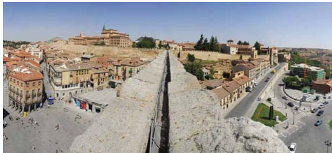
Vista desde el canal del Acueducto

Dado que los restos aparecidos no son visibles se puede conocer la ciudad romana en el Museo de Segovia donde se encuentran depositados y expuestos los materiales, no sólo de la capital sino de los numerosos yacimientos de la provincia.